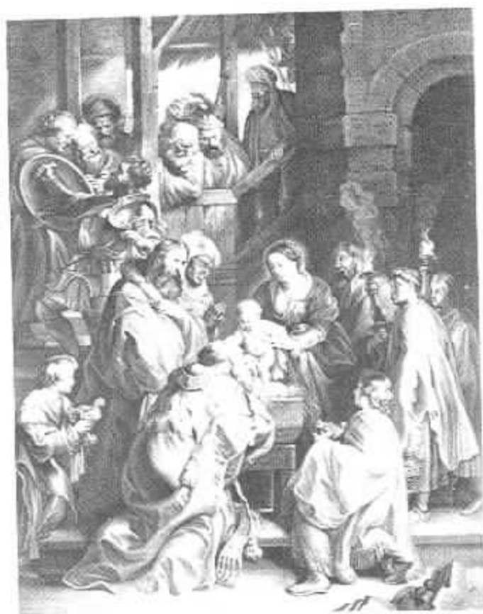
11 Nicolaas Lanwers, De Aanbidding der Koningen , 1620-21, naar Rubens