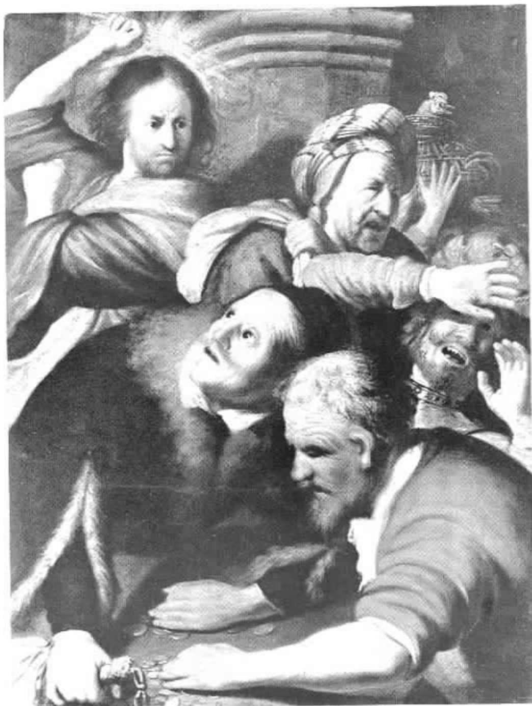
3 Rembrandt van Rijn, Christus verdrijft de Wisselaars uit de Tempel, 1626, Moskou, Puschkin Museum