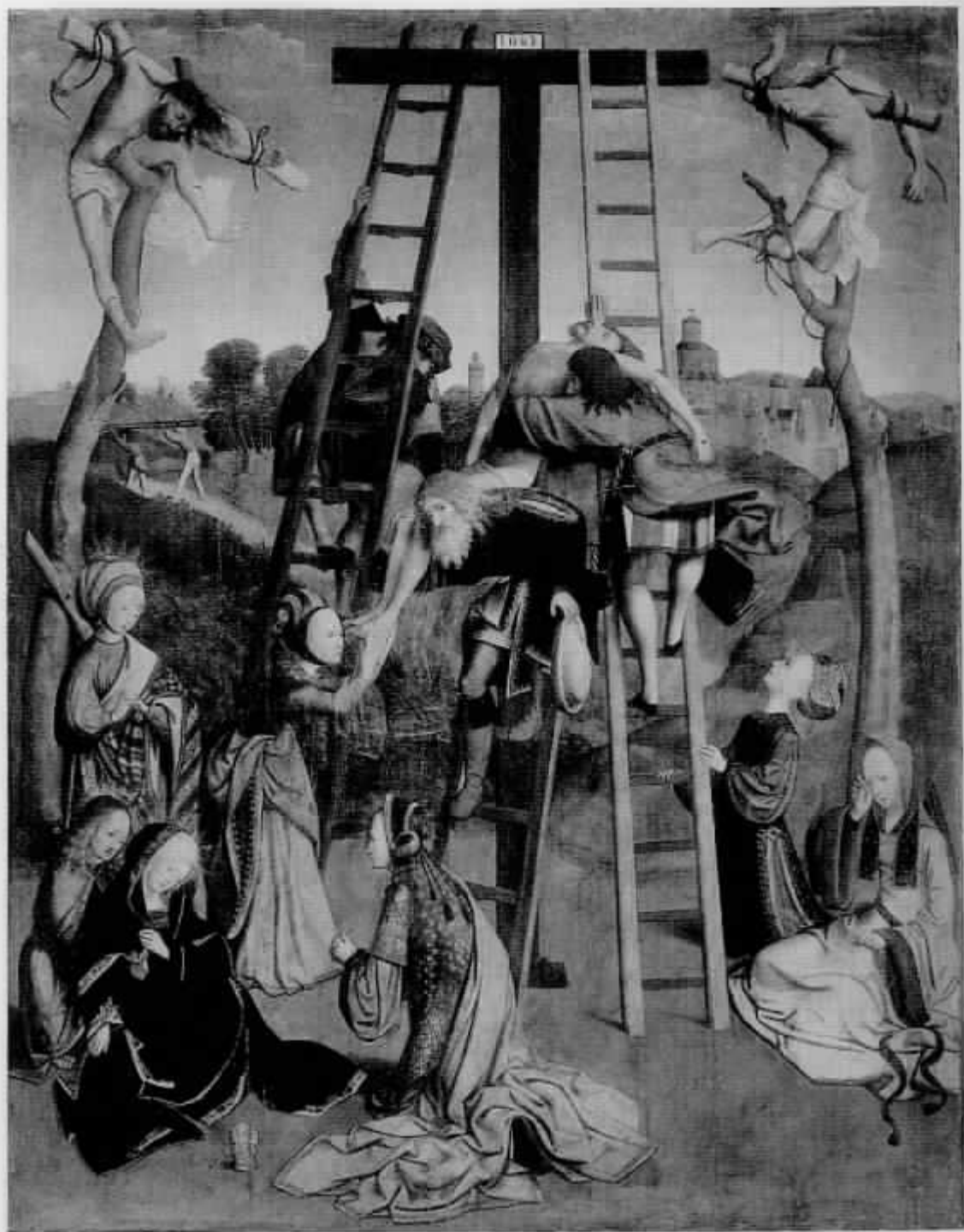
Afb. 1. Meester van de Kruisafneming uit de verzameling Figdor, Kruisafneming. Paneel, 131 x 102 cm. Verloren gegaan in 1945, voorheen Kalser-Friedrich-Museum, Berlijn.