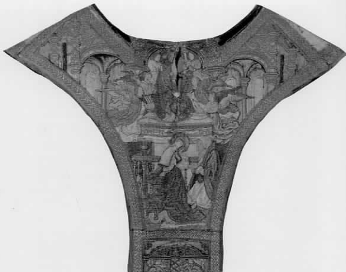
Afb. 3. Geborduurd gaffelkruis van een kazuifel, voorzijde bovenkant, Amsterdam 1507. Lucia en haar moeder aan het graf van de H. Agatha, Torskinge kerk.

balk. Hierdoor zijn op de beide zijden van het kazuifel vlak onder de halsopening enigszins driehoekige velden ontstaan, waarin plaats is voor een groot geborduurd tafereel. 6 Daaronder is dan plaats voor telkens twee verticale scènes.