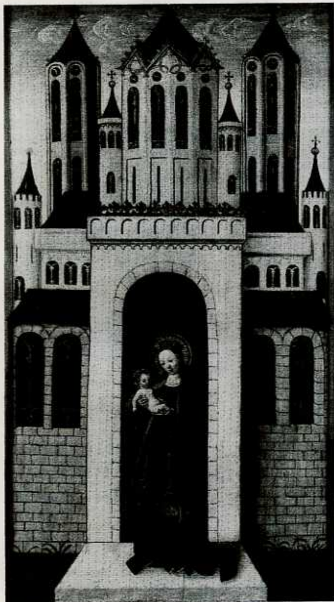
Afb. 3. Maria met kind met de Sta Maria Maggiore. Nederrijn, midden 15de eeuw Keulen, Erzbischöfliches Diözesan-Museum.