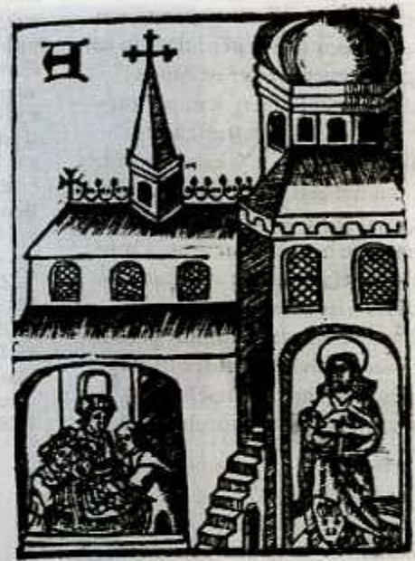
Afb. 2. De St.-Jan van Lateranen met Johannes en de besnijdenis. Houtsnede in 'Die costelike scat der gheesteliker rijdoem', Hugo Jansz van Woerden, Amsterdam 1519. Utrecht Rijksmuseum Het Catharijneconvent.

Want net als in het geval van de jubilé-aflat hadden de pausen in de 15de eeuw ook voor het verdienen van de gewone Romeinse aflat mogelijkheden geschapen deze in eigen land, stad of klooster te verdienen 8 . Het waren speciaal kloosterorden en geestelijke broederschappen, die van dit pauselijk privilege konden profiteren. Het bovenvermelde boekje noemt de regulieren van het kapittel van Windesheim, de benedictijnen, de dominicanen, de franciscanen en de leden van het O.L.-Vrouwegilde en St.-Annagilde in het dominicaner klooster te Haarlem. Om de begeerde aflat te verdienen moesten de leden van deze groeperingen bepaalde gebeden verrichten, die van groep tot groep echter verschilden. Zo moesten de dominicanen voor de afbeeldingen van de zeven hoofdkerken telkens een van de zeven boetsalmen lezen. De afbeeldingen van de kerken zijn als houtsneden in het boekje opgenomen. Het zijn dus geen vrijblijvende illustraties, maar zij hebben een functie bij het verkrijgen van de aflat. Elke houtsnede toont een kerkgebouw met in de deuropening de heilige, waaraan de kerk gewijd is. In de wand van het